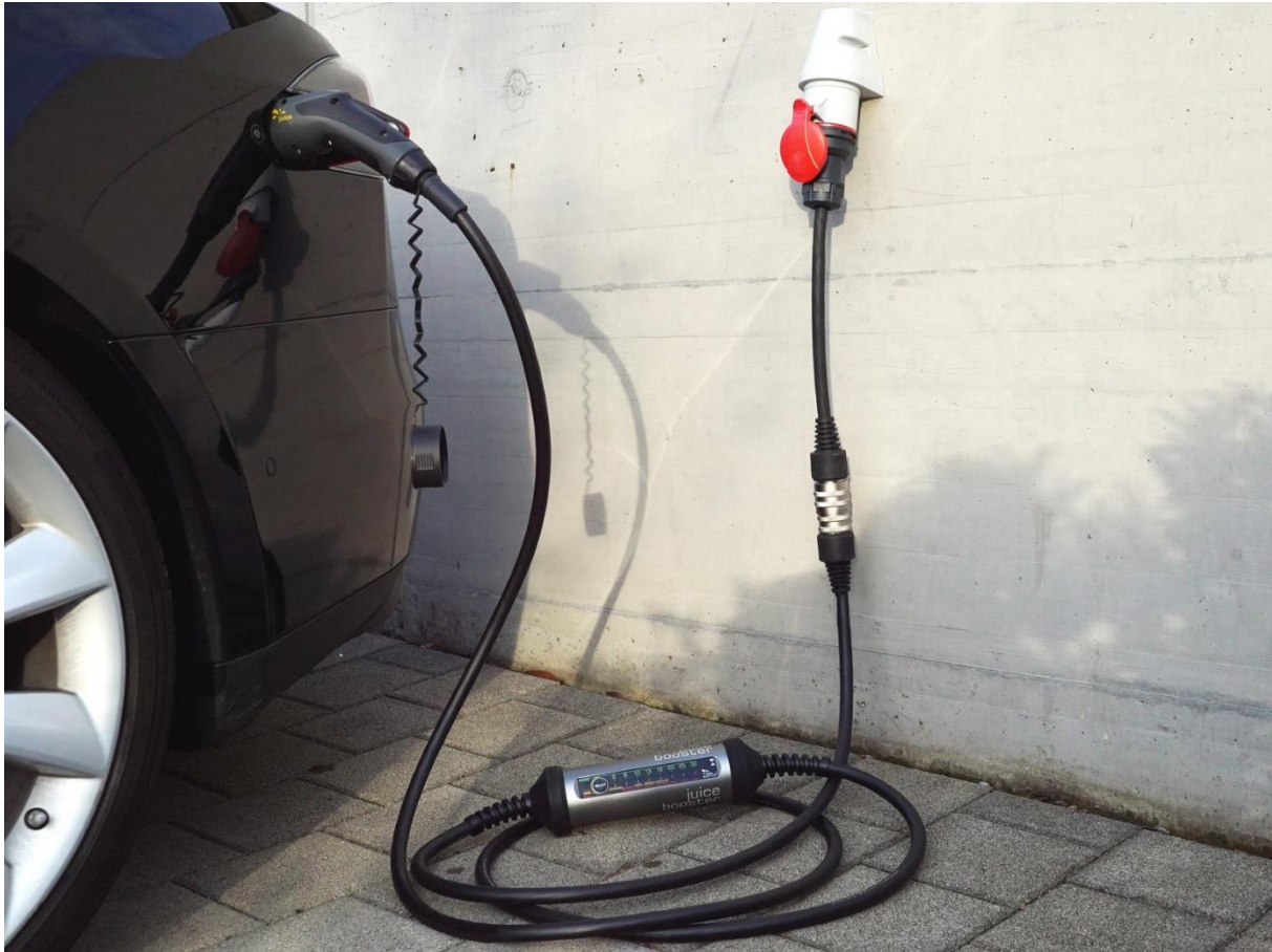
Beispiel einer mobilen Ladestation: der Juice Booster 2 an einer roten CEE Industriesteckdose.