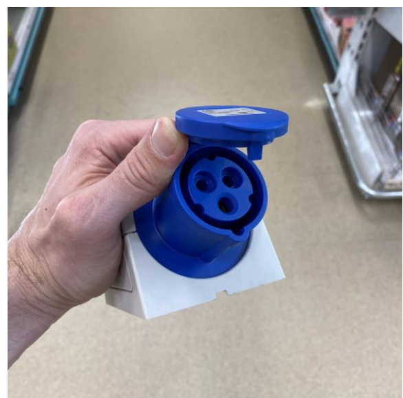
CEE16 230V Blau, auch "Caravansteckdose" genannt, da sie oft auf Campingplätzen eingesetzt wird.

In der Schweiz sind die folgenden Varianten der Industriesteckdosen verbreitet: